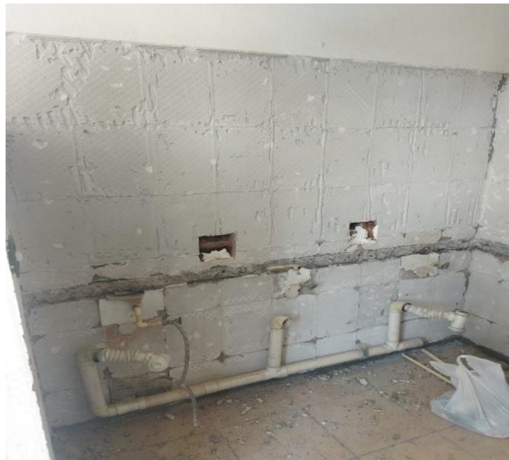
Fuente: Fotografía propia, tomada el 17 de agosto de 2025, en la Escuela Primaria Luis Chávez Orozco, Irapuato, Guanajuato.