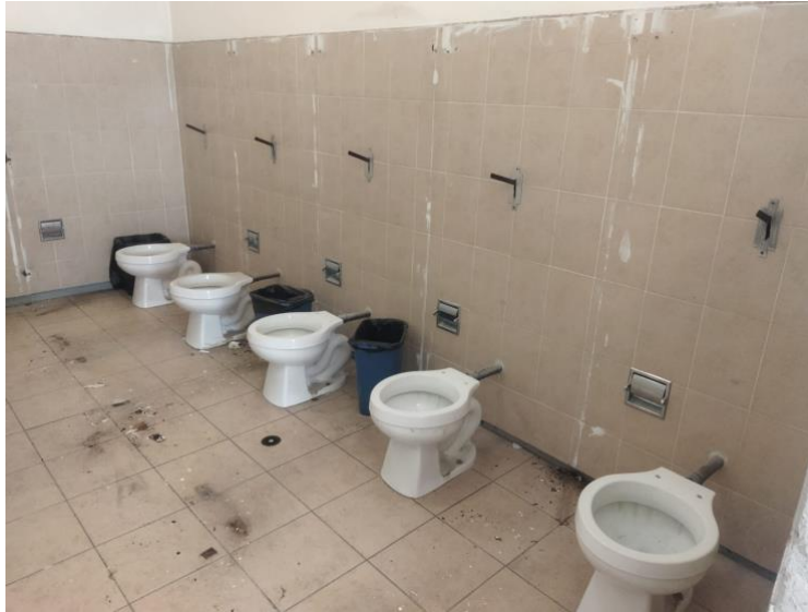
tomada el 17 de agosto de 2025, en la Escuela Primaria Luis Chávez Orozco, Irapuato, Guanajuato.