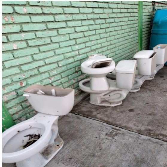
Fuente: Fotografía propia, tomada el 14 de junio de 2025, en la Escuela Primaria 15 de septiembre, Irapuato, Guanajuato.

evitan usar los sanitarios por miedo a enfermarse o ser víctimas de acoso, situación especialmente grave para las niñas durante la menstruación. Madres y padres de familia señalaron que son ellos quienes han tenido que asumir con sus propios recursos la compra de papel higiénico, jabón y productos de limpieza, pues las autoridades no garantizan ni siquiera estos insumos básicos. Además, han intentado, poco a poco y con las limitaciones de las cuotas escolares, realizar cambios estructurales en los baños: reparar fugas, colocar puertas improvisadas o pintar muros deteriorados. Sin embargo, estos esfuerzos comunitarios, aunque muestran el compromiso de las familias con la educación de sus hijas e hijos, son claramente insuficientes, ya que trasladan a la ciudadanía una responsabilidad que corresponde al Estado.